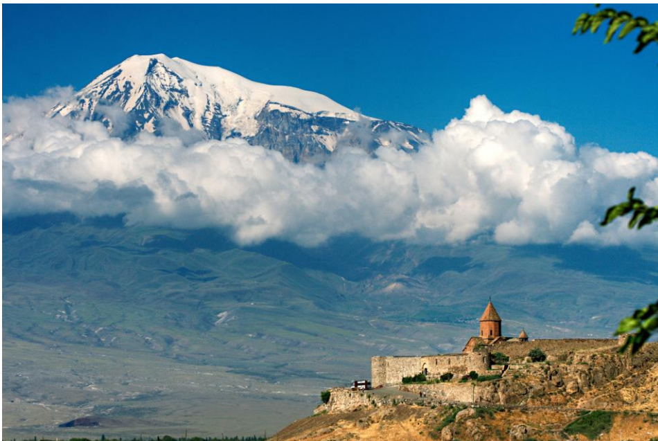
Рис. 4. Монастырь Хор Вирав, расположенный над подземной тюрьмой, в которой армянский царь Трдат III содержал Св. Григория. Вид на гору Арарат

После взаимного согласия Григорий и Мариам разводятся. Мариам уходит служить в монастырь (по другому источнику – Мариам умерла). Григорий, оставляя сыновей под надежной опекой, поступает на службу к Трдату, сыну царя Хосрова, убитого его отцом, чтобы искупить его грех. Тогда Трдат проходил через Кесарию с римскими войсками и направлялся в Армению с целью вернуть отцовский престол. Заметив способности и высокие знания Григория, царь Трдат, назначает его на высокую должность во дворце. После победы над персидским войском и возвращения престола, все служащие с царем направляются в Ериза, чтобы поклониться золотой статуе богини Анаит, сделать жертвоприношение в капище, поставить венки и цветы. Царь приказывает Григорию, зная, что он христианин, чтобы тот тоже возносил венки и поклонялся статуе. Когда Григорий отказывается, его приговаривают к 12-ти видам нечеловеческих пыток. Григорий терпит и выдерживает все пытки, после чего его бросают в колодезь Арташата – яму для смертников, в которой он находился 15 лет (рис. 4).