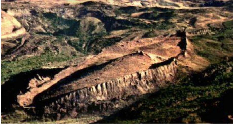
Рис. 1. Гора Арарат и возможное месторасположение Ковчега

В Библии неоднократно упоминаются страна Араратская и горы Араратские (рис. 1, 2). «И остановился ковчег в седьмом месяце, в семнадцатый день месяца, на горах Араратских. Вода постоянно убывала, до десятого месяца показались верхи гор» [2].