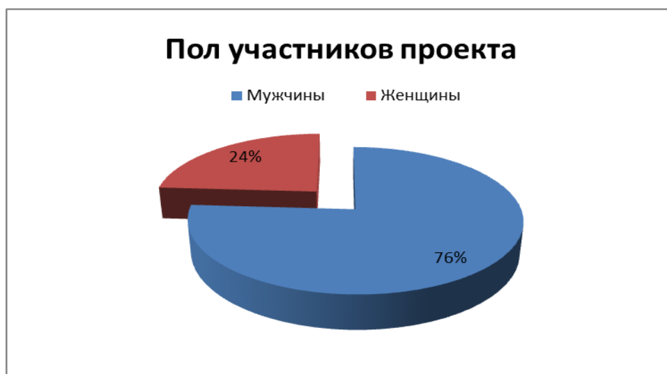
Рис. 4. Пол участников проекта

Спортивный беттинг в России сейчас развивается с большой скоростью, благодаря появлению интернета теперь каждый способен попробовать себя в этом деле, открывается всё большее количество букмекерских контор и консультационных центров.