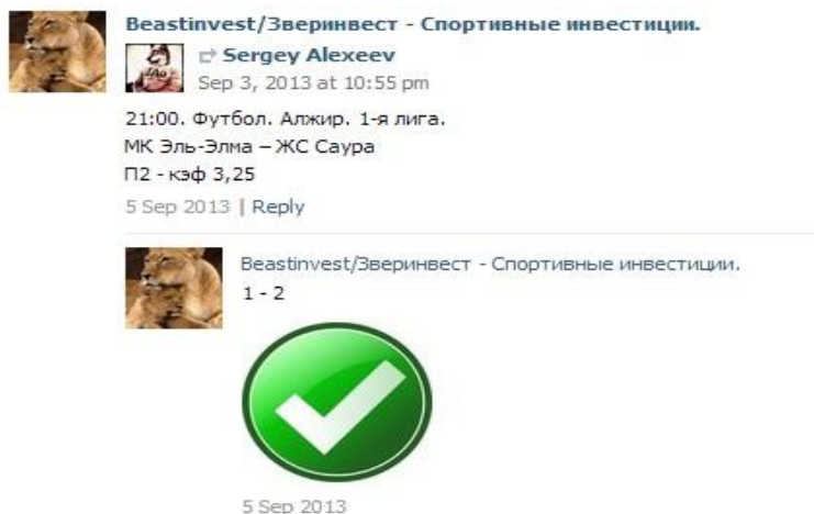
Рис. 1. Прогноз игры и результат

И такими людьми был создан проект VI, поначалу он работал как консультационный центр в группе «ВКонтакте», с самого начала в нём работали только 3 человека: 2 капера и администратор. Оба прогнозиста за своими плечами имели опыт работы в сфере спортивного беттинга более 6 лет. Каждый день каперы бесплатно выставляли свои прогнозы на игры, и сразу же после спортивных событий выкладывали результаты (рис. 1).