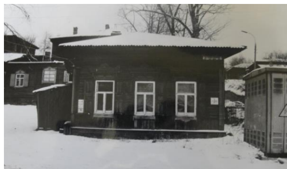
Рис. 7. г. Иркутск, ул. Байкальская, 33а