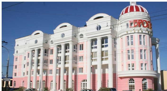
Рис. 22. г. Иркутск, ул. Байкальская, д. 69, гостиница «Европа»

Развитие и изменения архитектурного облика улицы Байкальской, от пожара 1879 года до наших дней, характеризуется в значительной мере несогласованностью исторической и современной застройки. Отсутствие плановости и продуманности типологического архитектурного ряда привело к утрате индивидуальных особенностей градостроительной культуры города Иркутска. Наиболее негативны значительные утраты все еще мало изученных объектов деревянного зодчества второй половины XIX века, специалисты считают деревянную архитектуру города этого периода «уникальным явлением мировой культуры».