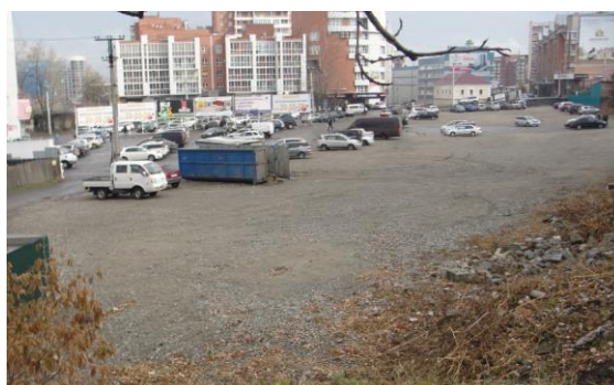
Рис. 8. Место, где располагался дом по адресу: г. Иркутск, ул. Байкальская, 33а