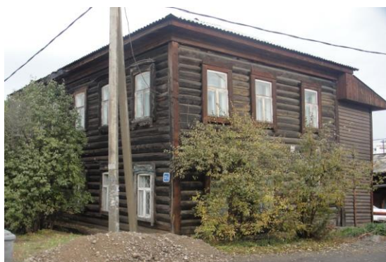
Рис. 6. г. Иркутск, ул. Байкальская, дом 37а. Южный фасад