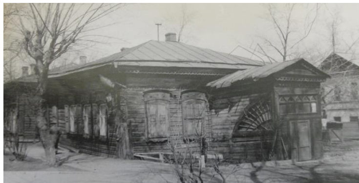
Рис. 3. Фото из архива 1985 г. г. Иркутск, ул. Байкальская, дом 19г. Юго-Восточный фасад