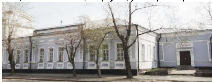
Рис. 11. Центральная городская библиотека имени А.В. Потаниной