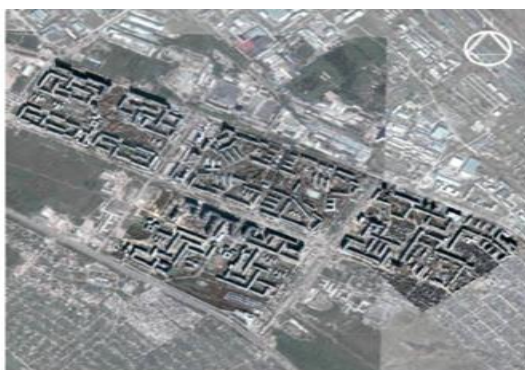
Рис. 14. Вид сверху. GoogleMaps