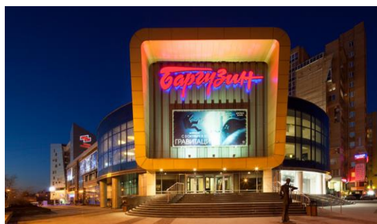
Рис. 19. Кинотеатр «Баргузин» 2014 г.

В последние годы по улице Байкальской активно начало развиваться коммерческое и жилое строительство. Как грибы растут жилые и торговые комплексы, офисные и гостиничные здания. Наблюдается разнообразие стилей и направлений – от зданий «под классику», до «хай-тек» из стекла и металла. Как пример, можно рассмотреть здание Байкал Бизнес Центра, строительство которого было начато в 1994 году, работает как деловой центр с 1997 года (рис. 20).