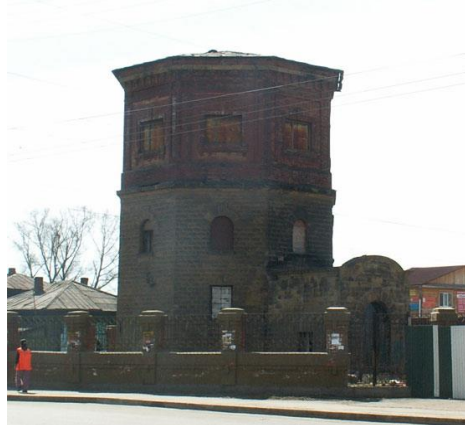
Рис. 12. г. Иркутск, ул. Байкальская, водонапорная башня

Карнизный поясок объема входной части, сложенный из блоков песчаника – высокий, профилированный, над входным проемом имеет лучковую форму, фланкирован узкими горизонтальными плечиками.» 8