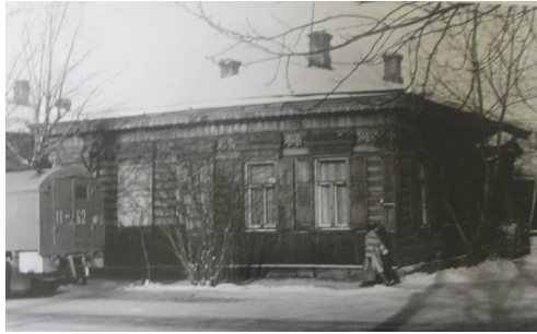
Рис. 9. г. Иркутск, ул. Байкальская, д. 7а