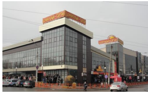
Рис. 10. ТЦ «Шанхай-Сити», г. Иркутск, ул. Софьи Перовской, д. 17