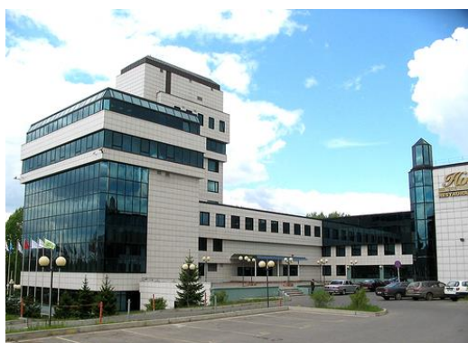
Рис. 20. г. Иркутск, ул. Байкальская, д. 295. Байкал-Бизнес-Центр

Жилой комплекс ЖК «Зеон», расположенный в районе остановки «Диагностический центр», имеет архитектурную форму, не характерную для нашего региона двор-колодец. Данный комплекс строится в 2006-2008 гг. Проект этого здания получил первую премию на выставке «Градостроительство. Иркутск-2007» документация разработана институтом Иркутскгражданпроект (рис. 21).