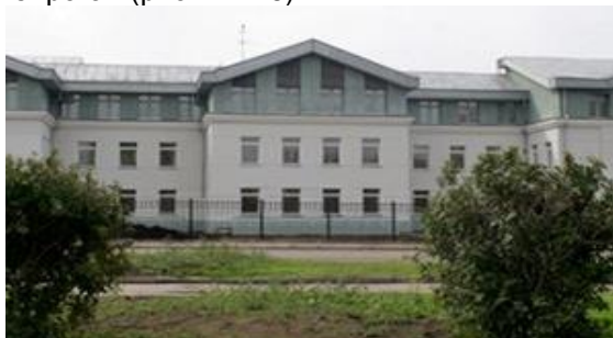
Рис. 13. г. Иркутск, ул. Байкальская, 118. Иркутская городская клиническая больница №1

Микрорайон Нижняя Лисиха представлял собой место новых для города планировочных принципов жилищного строительства. Застроен под авторством архитекторов – В.М. Аптекман, В.Ф. Буха, В. Воронежского, С. Нечволодова, В.А. Чемериса. Структура микрорайона, в основном, обладает открытым характером и ориентирована на транспортные оси: ул. Байкальская, б. Постышева, ул. Коммунистическая, ул. Сибирская (рис. 14–16)..