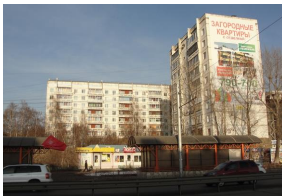
Рис. 18. Современный вид на микрорайон Байкальский