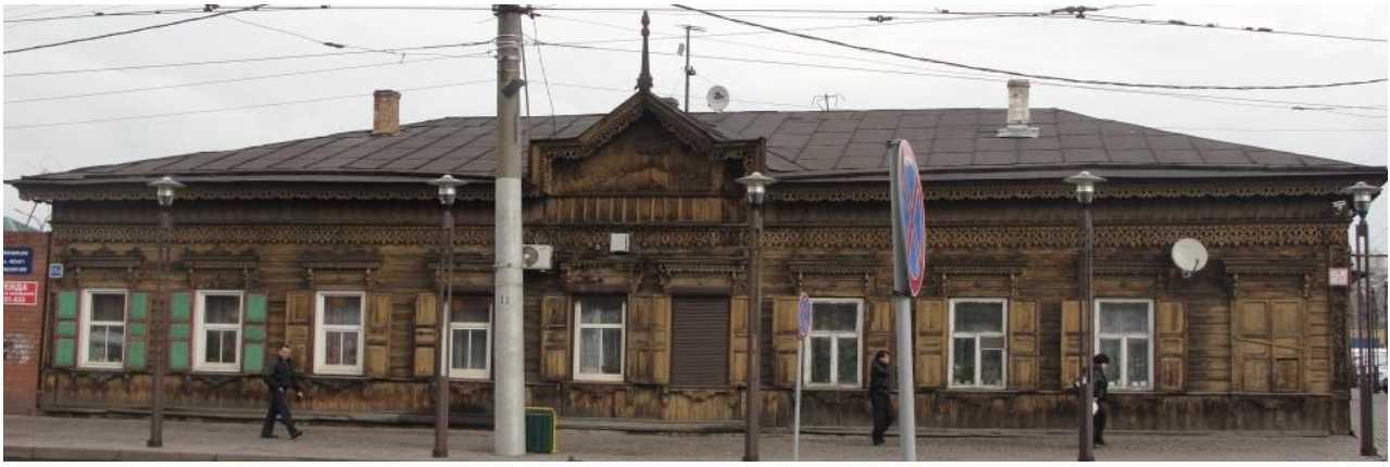
Рис. 1. «Доходный дом» г. Иркутск, ул. Байкальская, дом 11а. Главный Юго-Западный фасад»