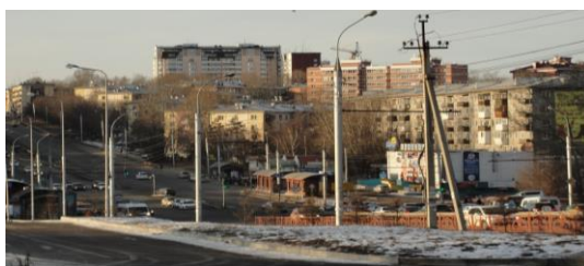
Рис. 16. Современный вид на микрорайон Нижняя Лисиха

В 1980 г. началось строительство нового микрорайона Байкальский (рис. 16–18). Территория микрорайона, представляющего собой компактное жилое образование на спокойном рельефе, ранее использовалась как сельскохозяйственные поля, где долгие годы многие иркутяне выращивали картофель. Находящийся на одной из главных планировочных осей города ул. Байкальской, микрорайон занимает не только выгодное географическое положение, но и имеет тесную связь с историко-культурным наследием территории. Соотносится с историей развития Иркутского релейного завода, основанного еще в 1934 году на базе многочисленных ремонтно-механических мастерских. Граничит с памятником культуры советского периода Иркутская ГЭС, а также с другим объектом культурного наследия Амурским (Лисихинским) кладбищем, закрытым в 1960-е годы. В композиционном отношении застройка Байкальской имеет одно из самых ясных и лаконичных планировочных решений – использованием принципа «кустового» расположения групп жилых домов.