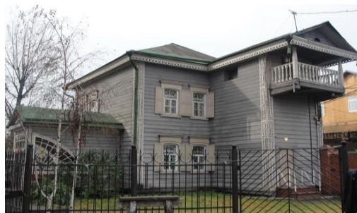
Рис. 4. г. Иркутск, ул. Байкальская, дом 19г. Северо-Восточный фасад