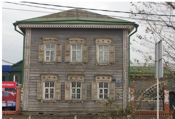
Рис. 2. г. Иркутск, ул. Байкальская, дом 19г. Главный Юго-Западный фасад