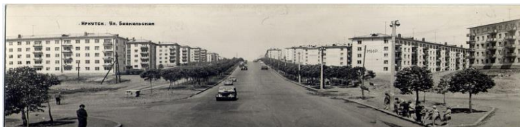
Рис. 15. Фото из архива. Микрорайон Нижняя Лисиха

Торцы домов были выполнены глухими для размещений декоративных панно или мозаик на фасадах, построенных по типовым проектам (панельные дома серии 1-335АС и кирпичные – 1-306С). Сюжеты на тему светлого социалистического будущего являлись массовым явлением, усиливающим образность пространства социалистического города. Планировочные оси улиц Байкальская и 6-я Советская были подчеркнуты шестью доминантными жилыми группами многоэтажных домов. Жилые группы вдоль ул. Байкальской были расположены на одинаковых горизонталях с развитой системой обслуживания, спускались к реке вдоль ул. 6-я Советская, формировали более закрытый характер улицы и подчеркивали границу жилого района.