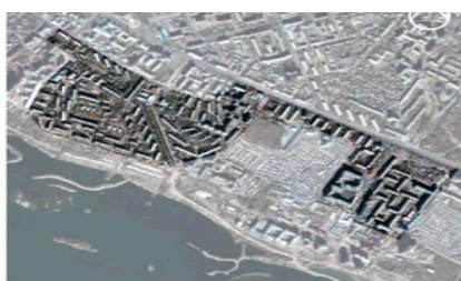
Рис. 17. Вид сверху. GoogleMaps

Планировка жилого образования состоит из четырех ключевых жилых групп, три из которых образованы на основе «строчной» застройки, что создает рассредоточенные на территории «ритмы». Четвертая представляет собой целостный перетекающий жилой объем разных типов: жилые дома и общежитие работников релейного завода. Эти четыре жилые группы объединены двумя главными осями пешеходного и транспортного движения. Связующим элементом застройки является школа, занимающая центральное положение на территории, одинаково соотносящаяся с другими элементами композиции. При этом детские сады располагаются на озелененных периферийных территориях. Достигается и определенный композиционный контраст сопоставления протяженных и коротких зданий, применяемых материалов бетонные панели и кирпич, а также подходами к проектированию типовое, серией 1-335АС и индивидуальное жилище с квартирами в двух уровнях, общежитие (рис. 17).