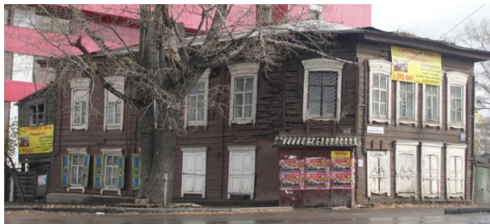
Рис. 5. г. Иркутск, ул. Байкальская, д. 29. Западный фасад

могольной формы с профилированным обрамлением. Карнизная плита имеет небольшой вынос, Понизу карниз украшен четырех ступенчатыми сухариками – свесами трапецевидной-формы.