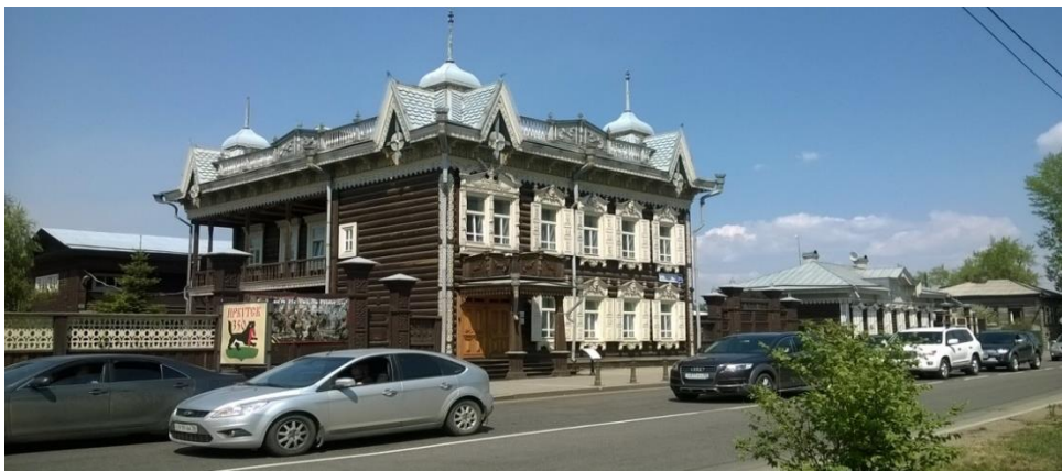
Рис. 1. Вид после реставрации: «Кружевной дом» («Дом Шастина»), архитекторы – А. В. Яковлев, В. В. Полутчева, С. И. Нефедьев и Н. Н. Южакова

Полутчева, С. И. Нефедьев и Н. Н. Южакова. Здание было восстановлено с переборкой сруба на цоколе из блоков песчаника. Строительство осуществлено СНРПМ.