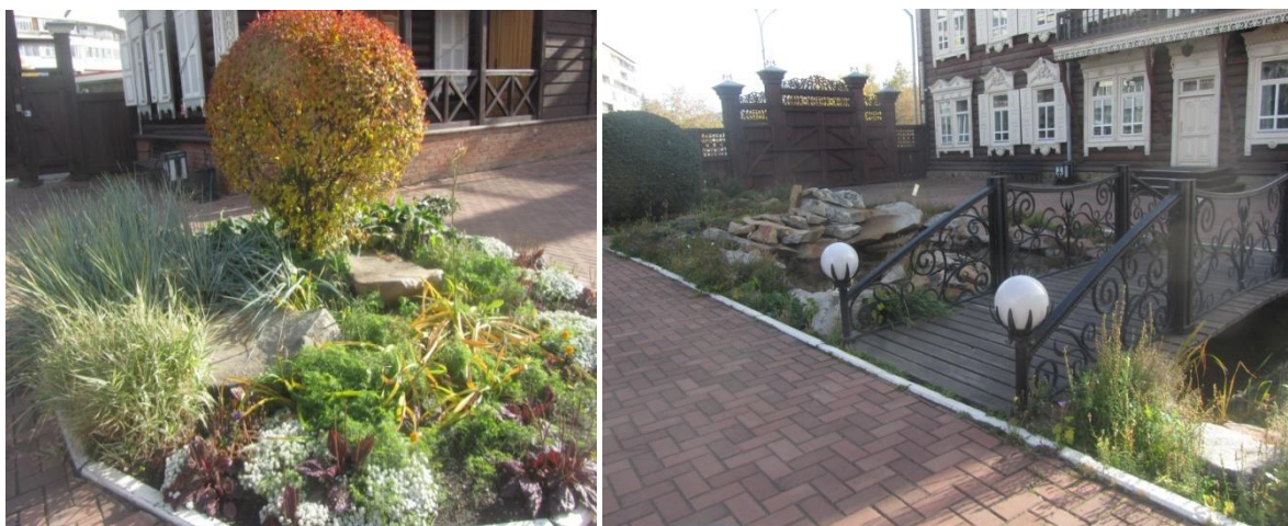
Рис. 5. Ландшафт Центра международных и туристических связей Иркутска: сад в традициях паркового искусства Китая

Парк также украсили небольшой фонтан и красивые клумбы. На торжественной церемонии открытия парка присутствовали представители двенадцати иностранных делегаций, сотрудники администрации города, депутаты городской Думы, Почетные граждане Иркутска.