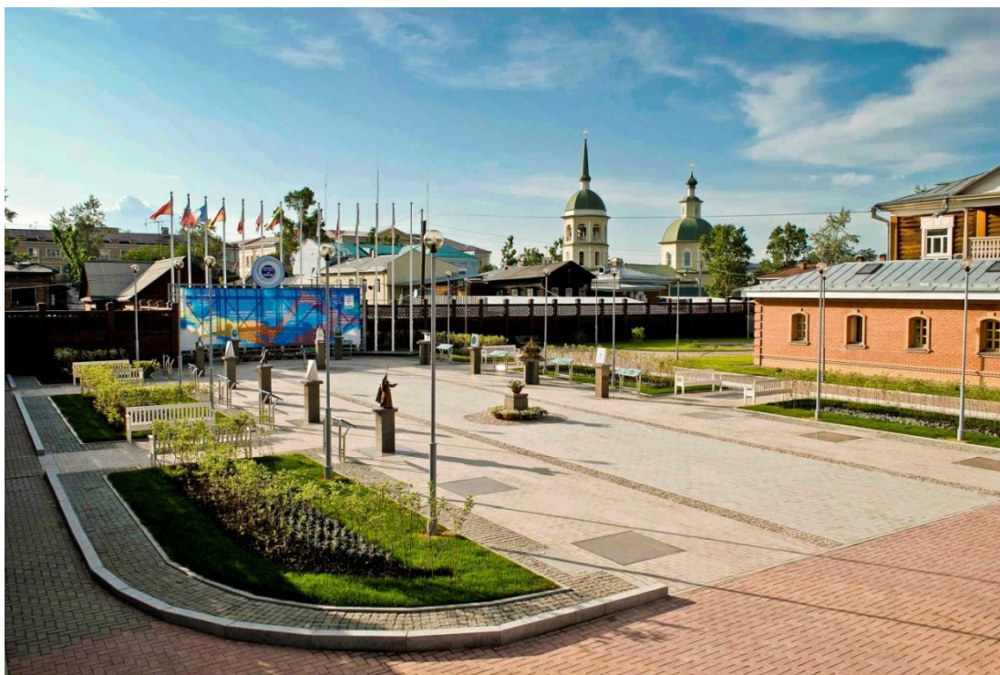
Рис. 3. Мини-парк символов городов побратимов Иркутска на территории исторического квартала в границах улиц Тимирязева, Октябрьской Революции, Энгельса и Декабрьских Событий: общий вид

Сотрудничество между городами-побратимами заключается чаще всего в образовательной, социальной или спортивной сфере. Такие города имеют право обращаться за поддержкой совместных начинаний в международные и европейские организации.