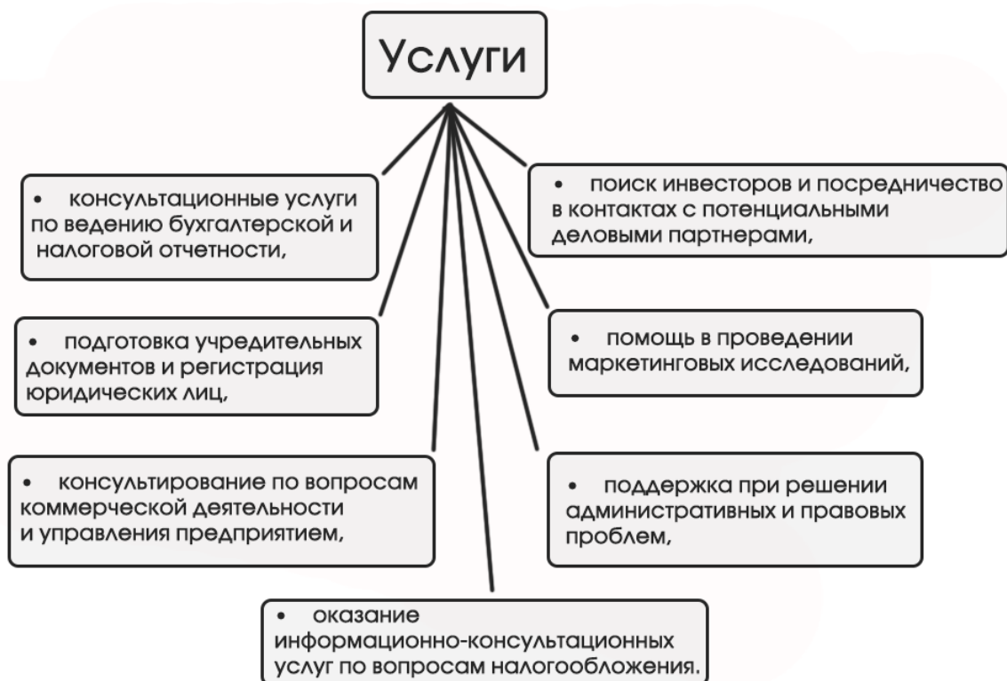
Рис. 1. Услуги, оказываемые бизнес-инкубаторами

На текущий момент количество таких организаций во Владимире превысило отметку 20. При этом они оказывают следующие услуги (рис. 1):