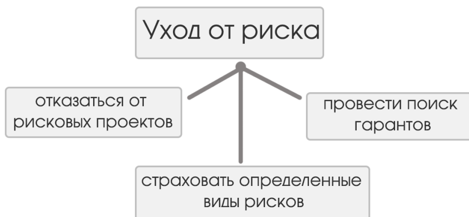
Рис. 2. Уход от риска

Уход от риска – первый и самый распространенный метод (рис. 2). Он включает в себя: отказ от рискованных проектов, страхование и поиск гарантов.