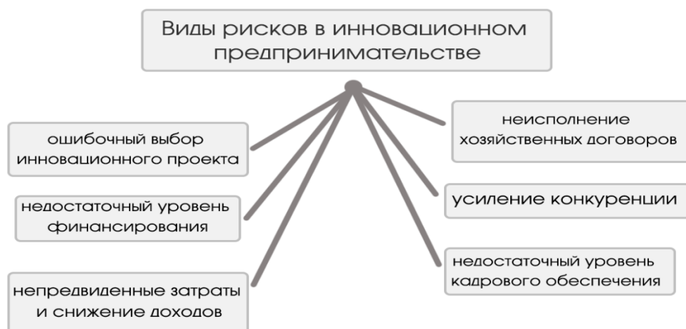
Рис. 1. Виды рисков

Риски, которые возникают в инновационном предпринимательстве, как правило, содержат в себе следующие основные виды рисков (рис. 1).