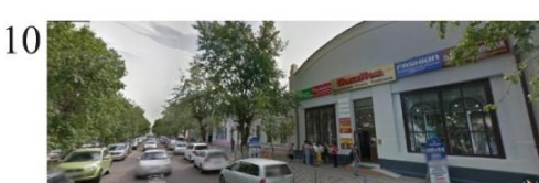
Рис. 3. Визуальное восприятие объектов культурного наследия ансамбля Гостинодворской площади