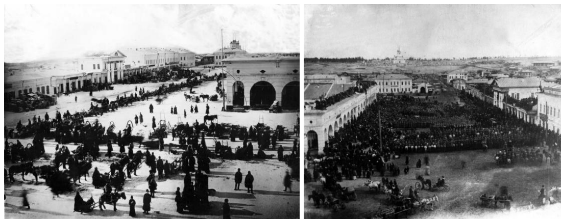
Рис. 2. Вид на Гостинодворскую площадь, торговые ряды и гостиные дворы

В 1834 г. мещане Верхнеудинска построили свои торговые ряды и достроили северную часть гостиного двора, названную Малыми торговыми рядами. Гостиный двор являлся складом для привозимых товаров и местом для оптовой торговли.