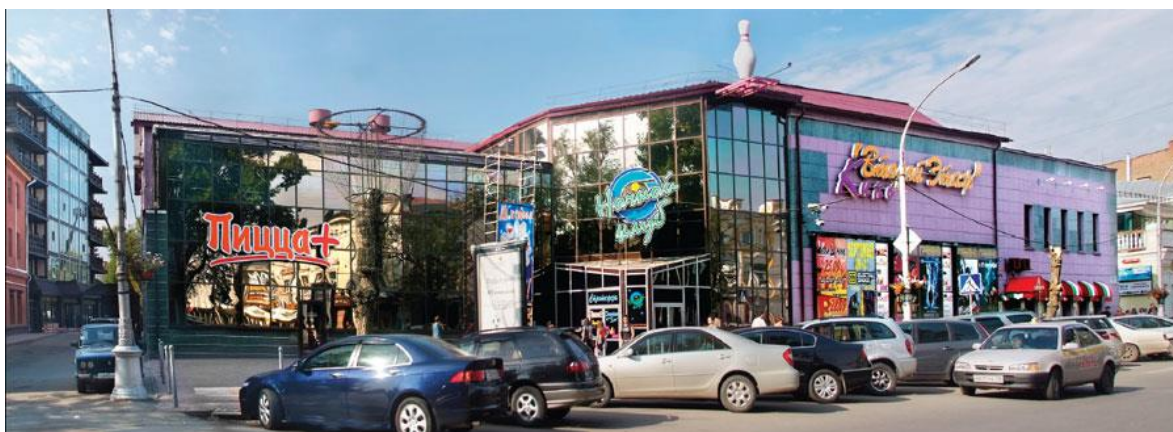
Рис. 6. Кинотеатр «Гигант» и ночной клуб «Стратосфера»

Предложенный для рассмотрения визуальный ряд можно продолжать и расширять. Однако и этого достаточно, чтобы увидеть, как далека от совершенства современная архитектурная среда города, ее дизайн и транспортные ситуации в Иркутске. Очевидны ошибки современных застройщиков, архитекторов и строителей (от которых, кстати, почему-то не уберегли принятые регламенты охранных зон и правил землепользования и застройки), низкий уровень транспортной культуры города, но основную «вину» за это несет, несомненно, неорганизованный и малокультурный рекламно-информационный бум – как по безобразному отношению к облику исторически сложившейся застройки, так и в связи с низким художественным уровнем собственно объектов наружной рекламы.