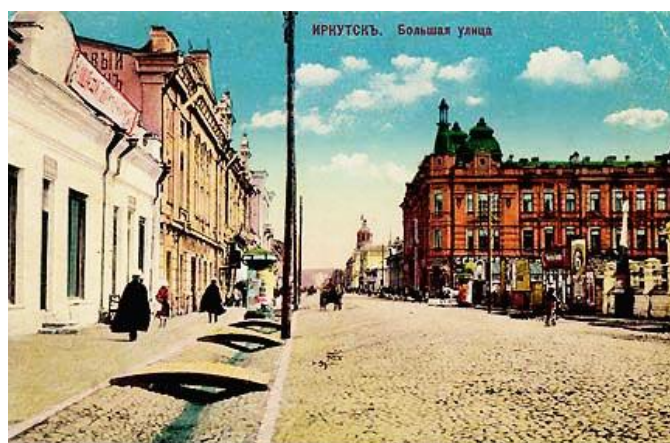
Рис. 1. Перспективный вид ул. Большой / ул. К. Маркса через столетие

Как показывает опыт, одно только освобождение имеющегося архитектурно-планировочного каркаса городской среды от более поздних «культурных» наслоений (временных построек, рекламных конструкций и т. д.), характеризующихся в специальной литературе как «информационный шум», в сочетании с другими реабилитационными мероприятиями способно вернуть значительной части города первоначальную художественную целостность и привлекательность, собрать разрозненные впечатления, зашифрованные в обрывках семантики исторического архитектурного языка в единый архитектурный образ города или в систему образов составляющих его композиционных частей, представить отдельные улицы, площади, средовые здания и памятники архитектуры в том виде, в котором они были задуманы авторами и впервые увидены современниками (рис. 1–6).