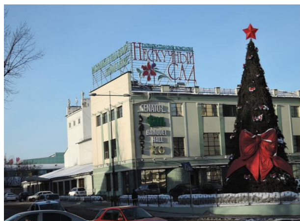
Рис. 2. Здание бывшего клуба завода им. Куйбышева по ул. К. Маркса