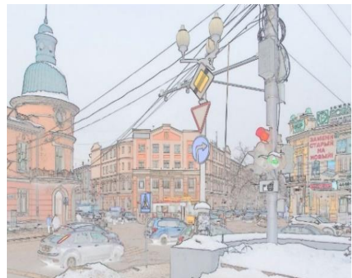
Рис. 5. Перекресток улиц К. Маркса и В.И. Ленина: слева – здание Русско-азиатского банка; по центру – крупнейшее учебное заведение Иркутска; справа – Театр юного зрителя им. А. Вампилова