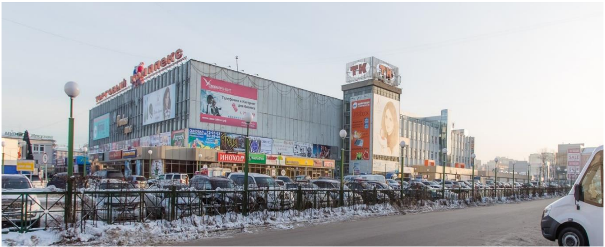
Рис. 3. Торговый комплекс на территории исторической площади Центрального рынка Иркутска в XX и XXI вв.