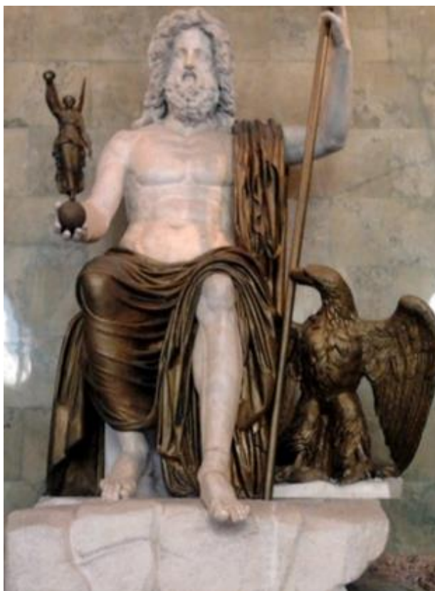
Рис. 2. Зевс Олимпийский - уменьшенная копия - повторение скульптуры Фидия V в. до н.э. в Олимпии

вулканов, страшные опустошающие смерчи. Таким у древних греков было объяснение этим природным явлениям. Кстати, название «Тайфун» происходит от греческого «Тифон».