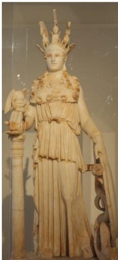
Рис. 4. Статуя Афины Девы в Парфеноне. Древнегреческий скульптор Фидий

Гестия богиня домашнего очага и семейного благополучия (рис. 6). В Древней Греции у каждого фамильного очага стоял жертвенник богини Гестии, так как очаг символизировал единение семьи. Такие жертвенники были единственной формой почитания Гестии, храмов ей древние греки не возводили. Когда античный эллин отправлялся на чужбину, он брал с собой огонь с жертвенника богини Гестии: тогда верили, что он будет охранять его и вдали от родных мест. Известно, что огонь в древней Греции считался самой чистой стихией, поэтому с культом Гестии было связано представление о целомудрии. Эллы верили, что она настояла на том, чтобы не выходить замуж. Изображали ее высокой и стройной девой в длинных одеждах.