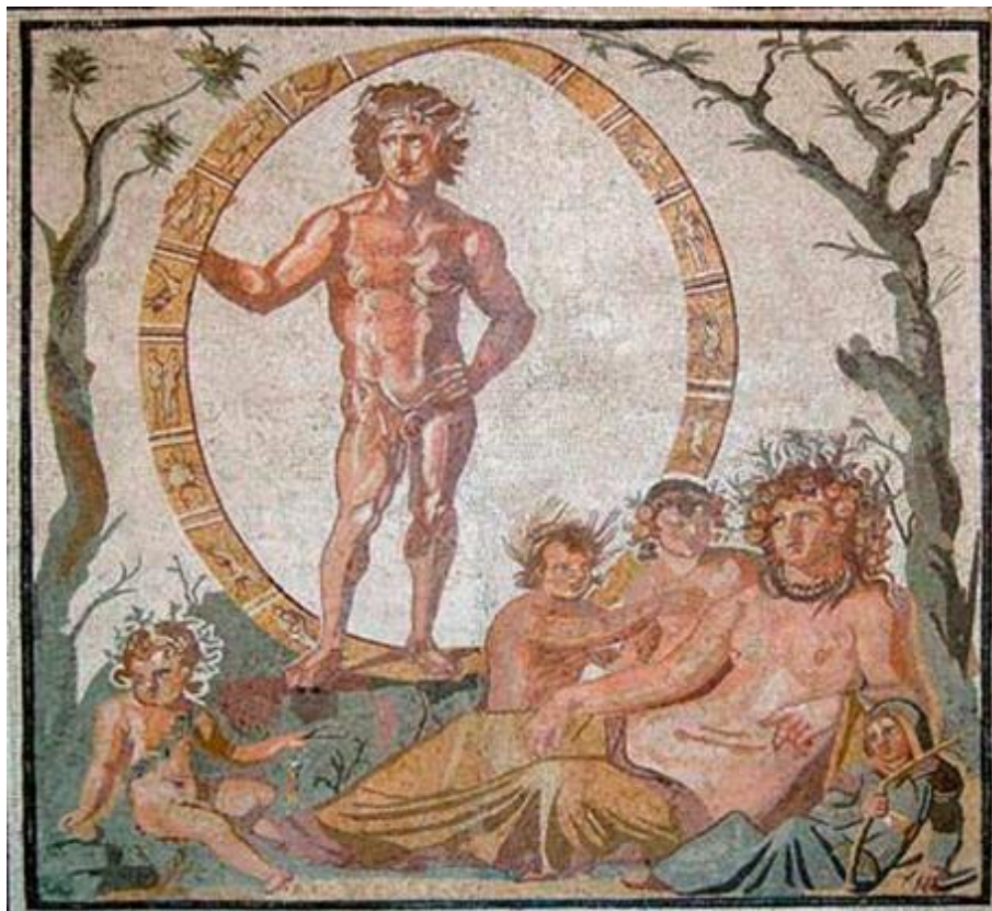
Рис. 1. Уран и Гея. Древнеримская мозаика 200–250 по Р. Х.

Уран, испугавшись силы и могущества циклопов и гекантонхейров, жестоко поступил со своими детьми, бросив их в Тартар – темную бездну подземного мира. Там они буйствовали, вызывая на земле потопаы, землетрясения, извержения вулканов, цунами.