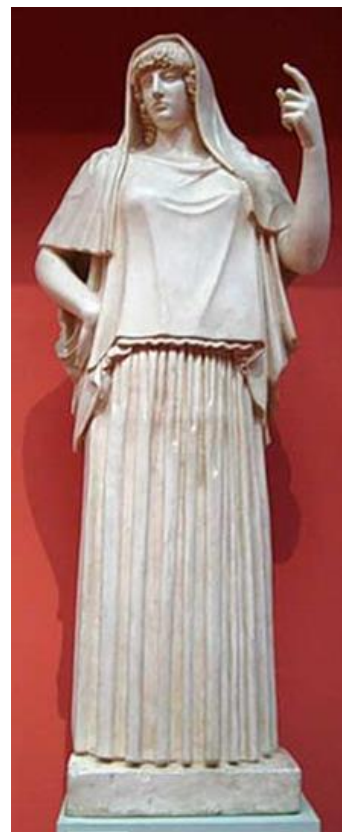
Рис. 4. Богиня Гестия

Деметра – богиня плодородия, покровительница земледелия. Деметра – олицетворение истинной матери. Богиня опекает урожай, возвращает деревья и не может представить собственную жизнь без детей. Но податливая спокойная женщина готова разрушить все, что сама создавала, когда в мирную жизнь дочери врывается чужой. Пожалуй, безграничная любовь сделала Деметру столь почитаемым божеством для древнегреческого народа. В честь Деметры происходили многочисленные праздники во время посевов и жатвы.