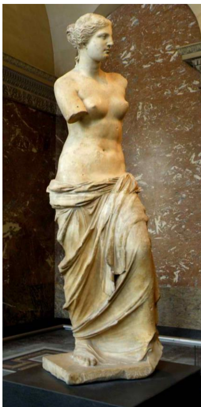
Рис. 3. Афродита Милосская – Символ красоты, гармонии и меры