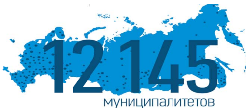
Рис. 1. Количество муниципалитетов, участвующих в проекте, и их расположение на карте Российской Федерации

После принятия вышеперечисленных программ во всех муниципалитетах с населением более 1000 человек утверждены современные правила благоустройства, учитывающие принципы развития городской среды, правила содержания муниципалитета, механизмы и формы участия граждан в преобразовании городской среды, а также закреплена ответственность за нарушение этих правил.