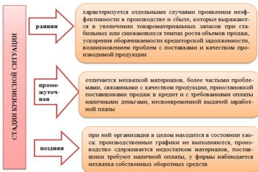
Рис. 2. Стадии кризисной ситуации

В понимании кризиса большое значение имеют не только его причины, но и последствия. Возможны следующие последствия: обновление организации или ее разрушение, оздоровление или возникновение нового кризиса, может быть, даже еще более глубокого и продолжительного. Кризисы могут возникать как цепная реакция [9]. Существует возможность консер-