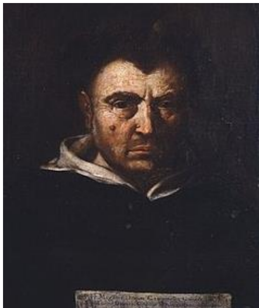
Рис. 2. Ф. Коцца. Томмазо Кампанелла, Италия

Томмазо Кампанелла (1568–1639) – итальянский философ, ученый, мистик и писатель эпохи позднего Возрождения, монах ордена доминиканцев и великий еретик. Это он предсказал Франции рождение будущего «короля солнца» – Людовика XIV. Не сложили Томмазо и 27 лет тюрьмы и жестоких пыток. Некоторые называли его безумным