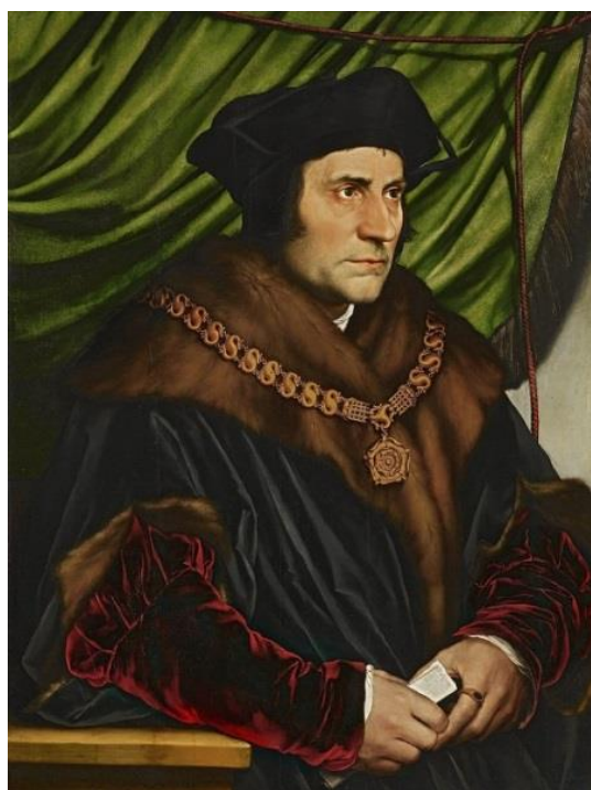
Рис. 2. Ганс Гольбейн (мл.). Портрет Томаса Мора, 1527 г.

систему общественного устройства в вымышленном островном государстве. Он был прекрасно образован, глубоко религиозен, имел хорошие манеры и тонкий юмор. В то же время Мор не принимал отступления от канонического католического права, а свои убеждения считал даже выше, чем ценность жизни. Будучи несколько лет верховным канцлером Англии, он всячески препятствовал развитию Реформации и протестантизма, защищал верховенство Папы Римского, отвергал нарушение церковных правил даже для короля. Именно за это он и был казнен 6 июля 1535 г., а спустя 400 лет канонизирован католической церковью в лике святых [4].