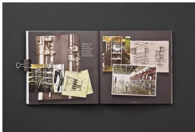
Рис. 3. Портфолио студии графического дизайнера ALU

3. Портфолио студии графического дизайнера ALU (рис. 3).