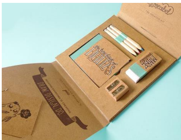
Рис. 2. Портфолио иллюстратора Lisa Dino

2. Портфолио иллюстратора Lisa Dino (рис. 2).