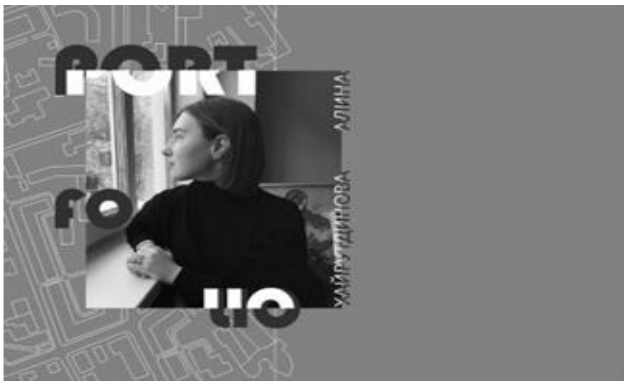
Рис. 6. Обложка портфолио, автор – Хайрутдинова А.Н., студентка кафедры МДИ и дизайна им. В.Г. Смагина

На этой странице все заголовки выделены прямоугольными рамками, текст отформатирован по ширине, в левом нижнем углу указана контактная информация (номер телефона, электронная почта, инстаграмм с