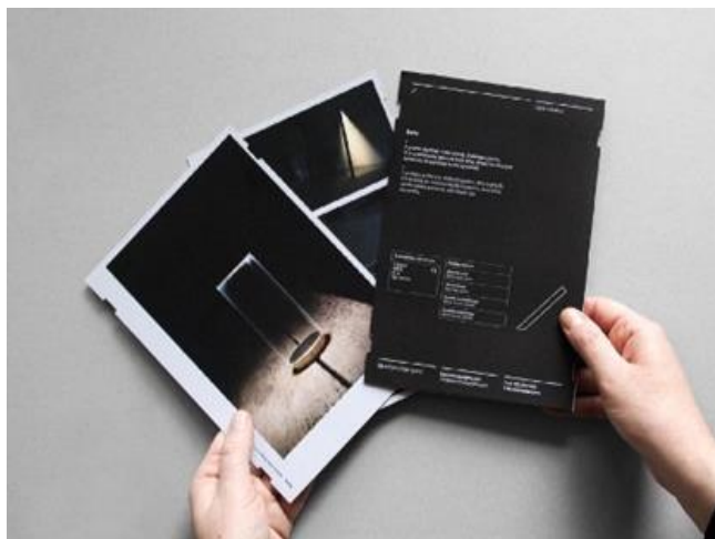
Рис. 5. Портфолио дизайн-студии Simone Scimmi

5. Портфолио дизайн-студии Simone Scimmi (рис. 5).