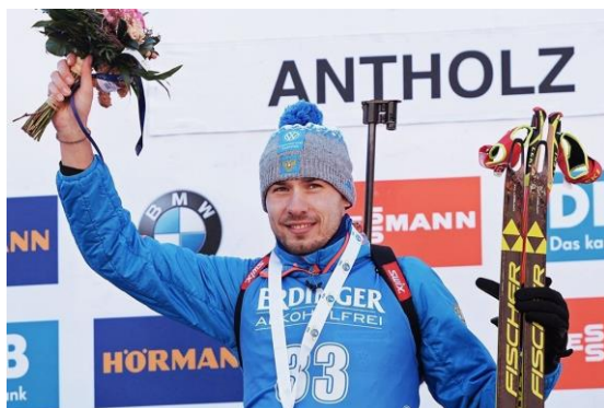
Рис. 5. Антхольц (гонка преследования), 2013 г.

Однако в спортивной карьере Антона Шипулина возникали некоторые трудности. Так, 18 декабря 2018 года после разбирательства в суде по обвинению со стороны Австрии в использовании допинга австрийцам пришлось отказаться от обвинений ввиду отсутствия доказательной базы. По словам Шипулина, на фоне его проблем со здоровьем подобный стресс стал для него последней каплей. Неприятной также была ситуация, связанная с тем, что сборную России по биатлону не пригласили на Олимпийские игры 2018 года. Необходимо отметить, что в тот момент российские