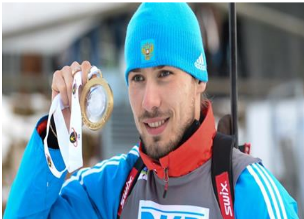
Рис. 1. Антон Шипулин – олимпийский чемпион

что родители Антона были мастерами спорта по биатлону и лыжным гонкам. Но однажды винтовка его сестры, занимавшейся биатлоном, приковала внимание юного спортсмена, и тогда тот твёрдо решил опробовать себя именно в этом спорте (рис. 2).