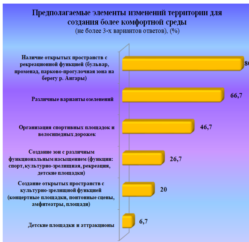
Рис. 2. Предполагаемые элементы изменения территории для создания более комфортной среды, (%)