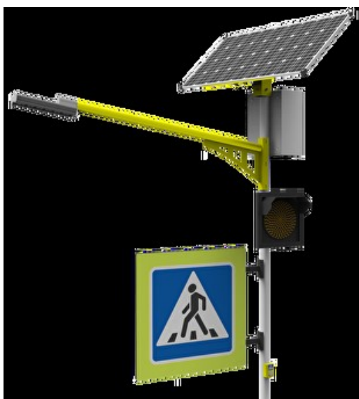
Рис. 1. Автономная система пешеходного перехода

Вследствие такого подхода настороженность водителя при активизации системы значительно повышается, поскольку пропадает эффект его привыкания к постоянно мигающему светофору. Установка системы освещения пешеходного перехода не нуждается в больших финансовых вложениях и обходится без устройства траншей, приобретения и защиты кабеля, рекультивации траншей, присоединения к электросети.