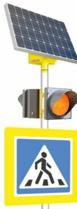
Рис. 5. Светодиодный светофор на солнечной батарее

Установки набирают популярность, так как имеют ряд преимуществ по сравнению с традиционными нерегулируемыми переходами.