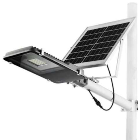
Рис. 4. Светодиодный светильник на солнечной батарее

Светофоры Т.7 являются светодиодными и работают на солнечных электростанциях (рис. 5). Их также устраивают для обеспечения безопасности пешеходов на нерегулируемых переходах. Но устройство светофора с присоединением к сети требует больших затрат, а вне населенных пунктов подключение к сети практически невозможно. Наилучшим выходом является светофор на солнечной электростанции, разработанный преимущественно для бесперебойной работы в условиях зимнего периода и в ночное время. Они включают современные технологии: яркие светодиоды, монокристаллические солнечные батареи, производительные гелиевые аккумуляторы, микропроцессорные контроллеры [4,6].