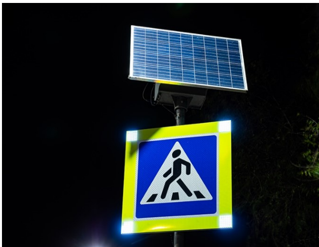
Рис. 3. Светодиодный дорожный знак на солнечной батарее